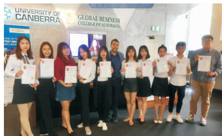
“国际精英计划”结业合影

环球嵌入式课程 (简称GIP) 是面向学生提供全方位、多元化、国际化的境外学习体验及实践机会而开设的为期两周的海外研修课程。学生可选择艺术、商务沟通、学前教育专业等多个方向的GIP课程, 前往海外体验全英语沉浸式课堂, 参观当地企业、名校和著名景点, 参与专题讲座和学术交流活动, 课程结束后可兑换相应的通识选修课学分4-6分。