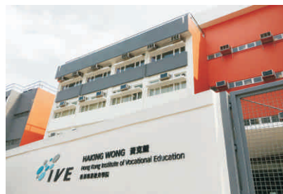
香港专业教育学院