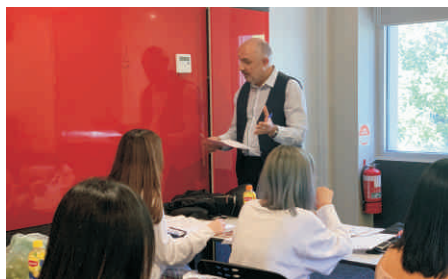
墨尔本雅思研修课程