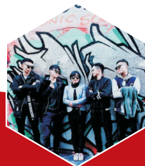
计算机网络技术专业学合合影留念