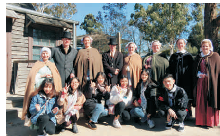
国际艺术设计海外研修课程 (GIP)