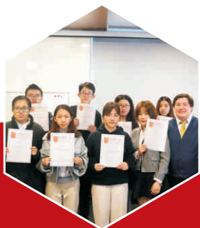
会计专业海外创新班 学生毕业留念