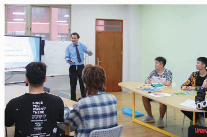
风趣幽默的外教课堂（免费雅思培训班）