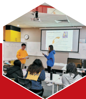
市场营销专业海外创新班 学生课程实践