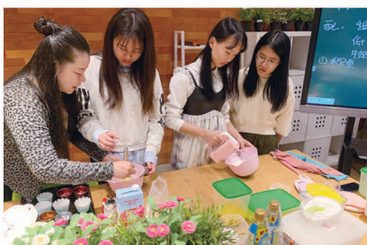
丰富多样的课外活动（烘焙手工课）