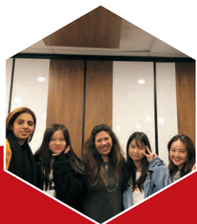
学前教育专业学生合影留念

备注：海外创新班的学生，安排4周时间赴海外学习，课程费全免，学生个人只需承担住宿费、生活费、签证费、机票及保险费等费用，4周约1.7万人民币至2万人民币（费用仅供参考，消费根据个人实际情况而定）。